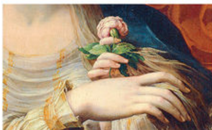
Vittorio Sgarbi Parmigianino tra Classicismo e Manierismo

“Pochi artisti sono immobili e definitivi come Parmigianino. La vita tormentata e inquieta, il suo destino e il suo spirito di avventura indicano un’affinità di carattere con l’impetuoso Caravaggio, e la sua biografia potrebbe accendere curiosità morbose e riservare stimoli per affascinare anche i più distratti. Il suo catalogo è uno schieramento di capolavori: a partire dai più antichi affreschi di San Giovanni Evangelista fino a quelli estremi di Santa Maria della Steccata, dalla Madonna con il Bambino e i santi Giovanni Battista e Girolamo fino alla Antea, dalla Schiava turca alla Madonna dal collo lungo. È impossibile, per chi lo conosce, per chi lo osserva, per chi ne coglie lo spirito di osservazione nel tratto, non appassionarsi al Parmigianino. Egli ha conservato nei secoli la sua imperturbabile immobilità, rimanendo integro come un diamante e accrescendo anzi nel tempo la sua luce.” Dall’introduzione di Vittorio Sgarbi.